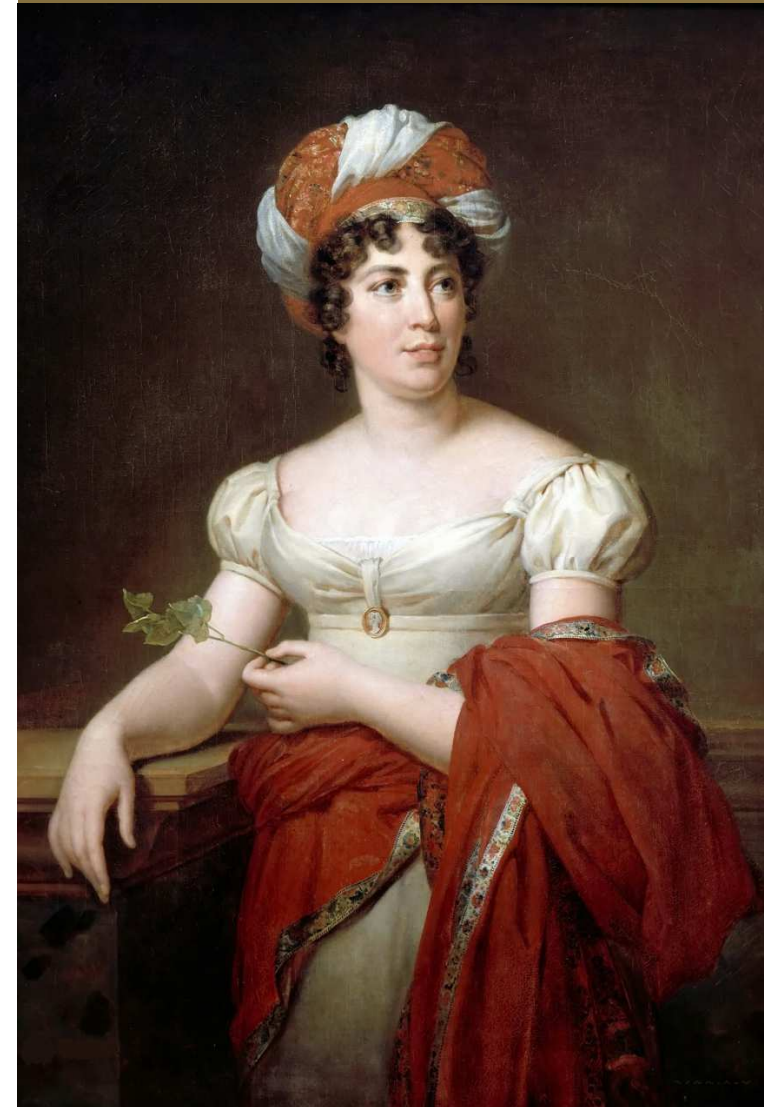
Ritratto di Mme de Staël